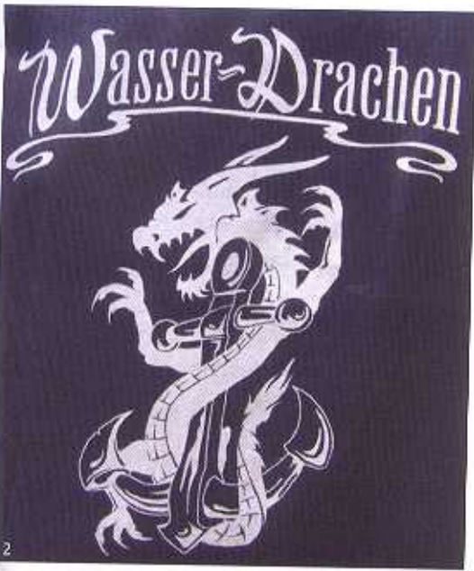
Abb. 1: Die Wasserdrachen Abb. 2: Das Logo der Wasserdrachen Abb. 3: Die Wasserdrachen in Aktion